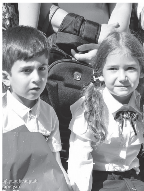
Կրթության նախարար Արայիկ Հարությունյան