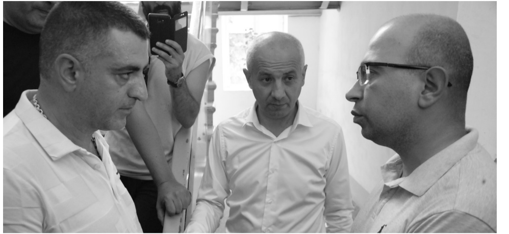
Վարչապետին, պատկան մյուս մարմիններին՝ ակնկալելով միջամտություն՝ ի շահ Կապանի եւ մեր երկրամասի»:

Ստեղծված իրավիճակի մասին գրավոր տեղյակ կապահենք նաև հանրապետության