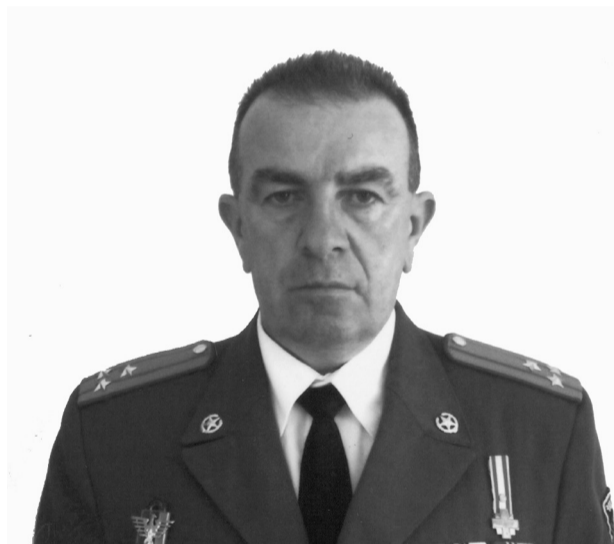
Սիրելի աշակերտներ, կրթության ու դաստիարակության գործի մկիրայներ, ծնողներ

Յուրաքանչյուր ազգ կամ պետություն հզոր է նրանով, թե ինչպիսի սերունդ է աճեցնում, կրթում ու դաստիարակում: Կրթությունը եւ գիտելիքը բոլոր ժամանակներում ու գրեթե բո-